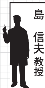
島 信夫 教授