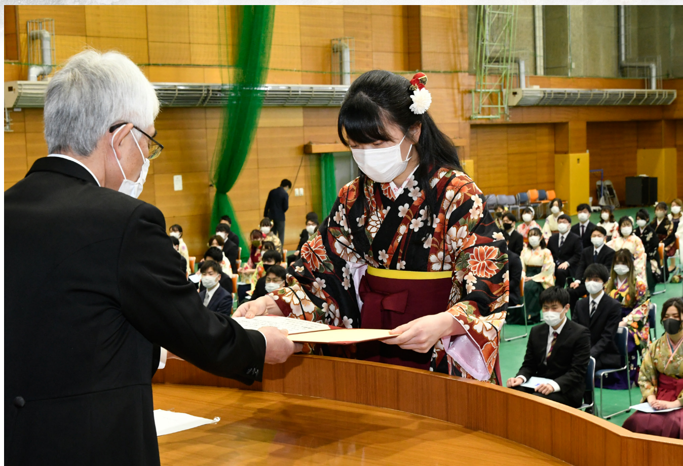
令和2年度 学位記授与式 2021年(令和3年)3月23日