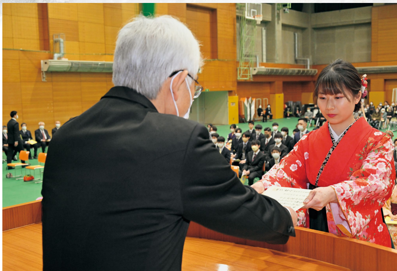
令和4年度 学位記授与式 2023年(令和5年)3月23日